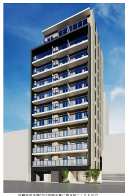
外観は成り立ちのイメージを基に描き起こしたもので、内装・内構等は多少異なる場合があります。